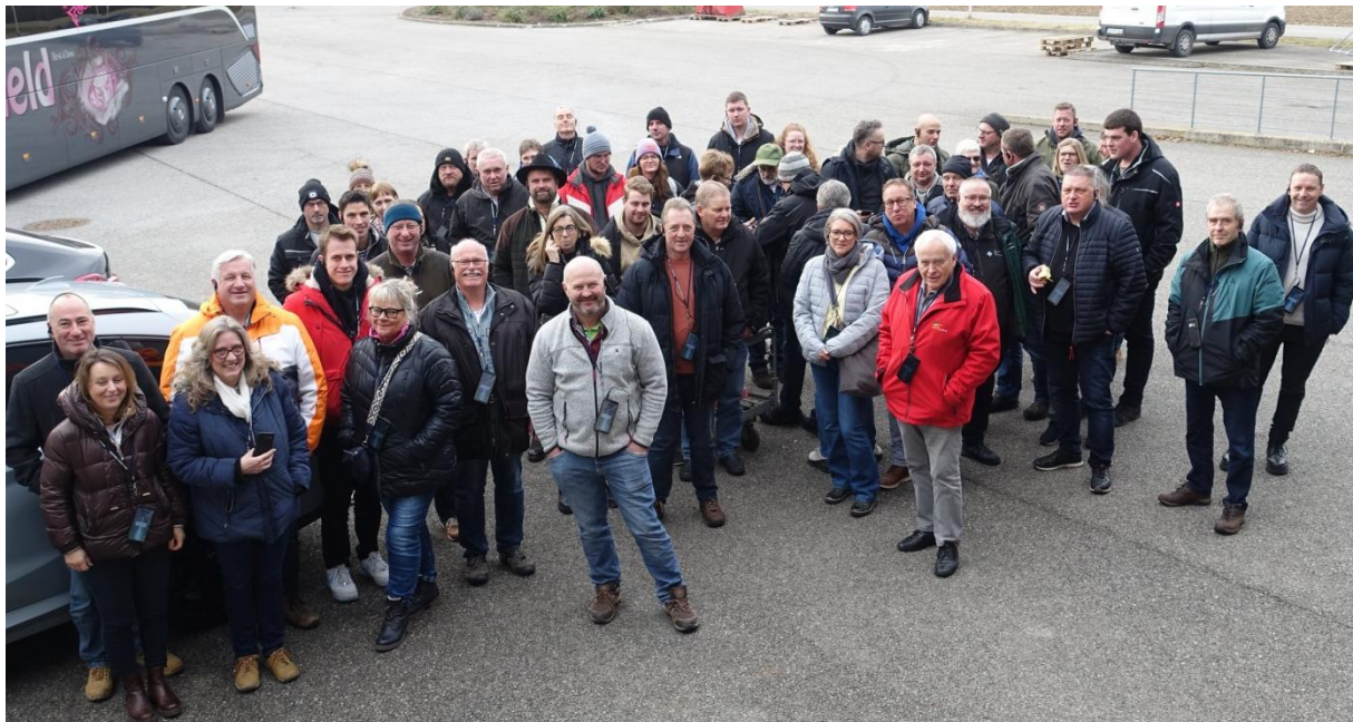
Die Teilnehmer der IGW-Wintertagung.